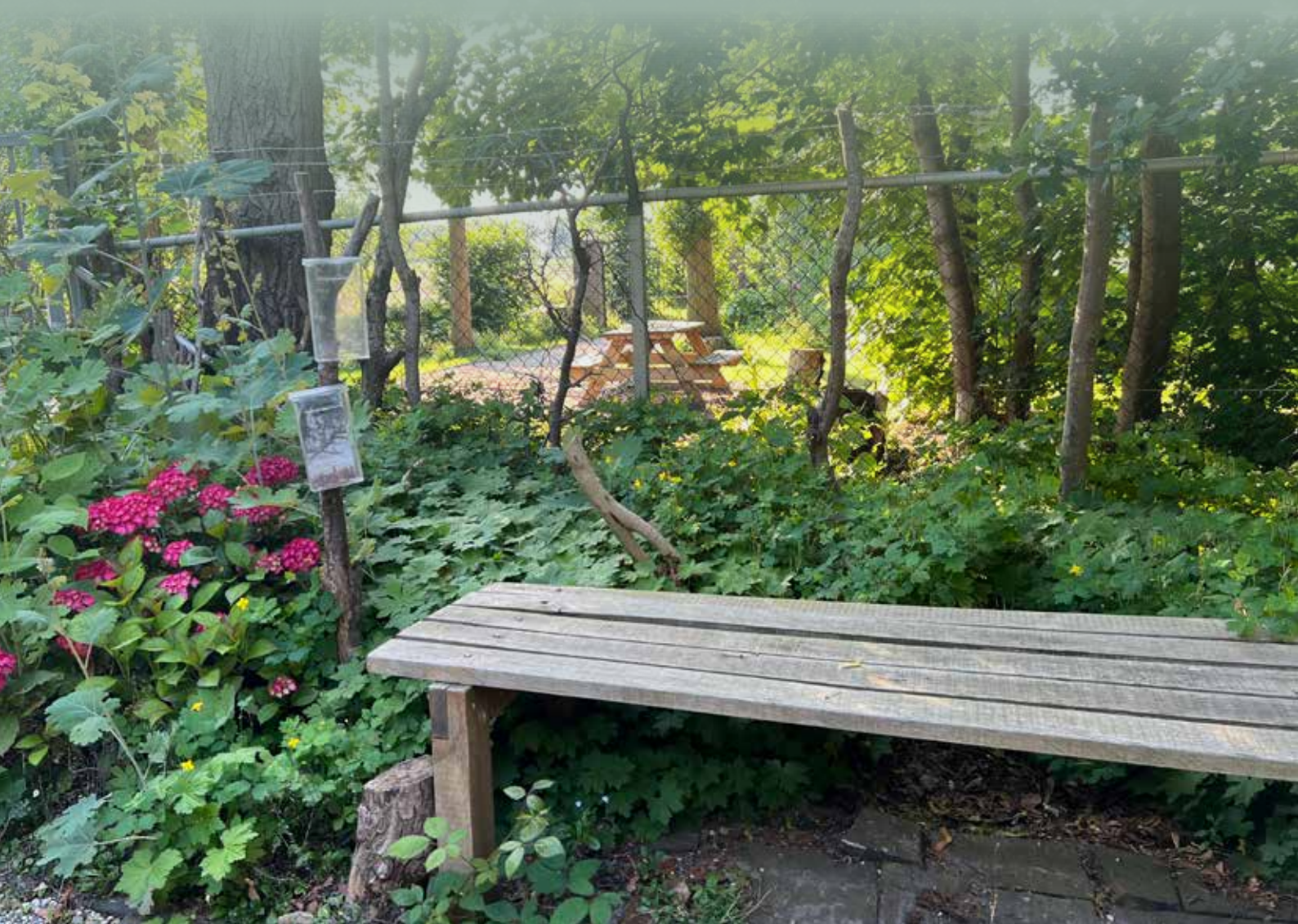
Bankje op de begraafplaats, ter overpeinzing van het leven