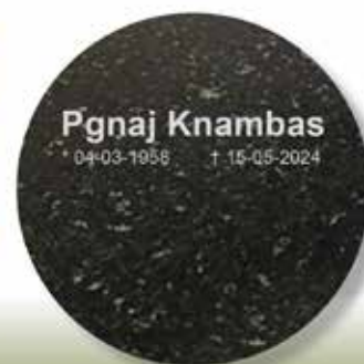
Voorbeeld van de granieten, ronde steen