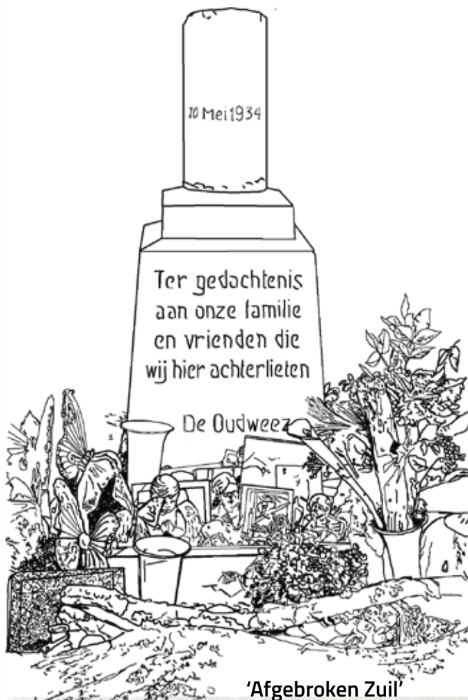
'Afgebroken Zuil' Symbool van het (jonge) afgebroken leven